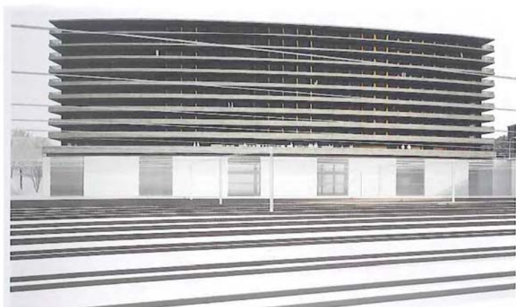
Vue générale du bâtiment depuis la Maison de la paix.

Surface brute : 8000 m 2 Niveaux : 10 (rez + 9) 135 logements, 243 lits dont → 72 studios (23,15 m 2 ) → 9 appartements de 2 chambres (52,6 m 2 ) → 18 appartements de 3 chambres (74,3 m 2 ) → 18 appartements de 4 chambres (114,6 m 2 ) → 9 appartements pour familles (75 m 2 ) → 9 appartements pour professeurs invités (49 m 2 ) Début des travaux : été 2011 Fin des travaux : septembre 2012