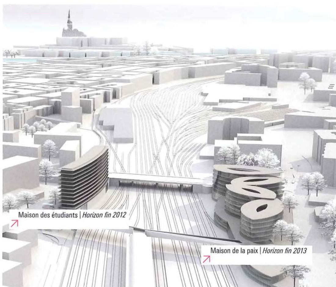
Maison des étudiants | Horizon fin 2012