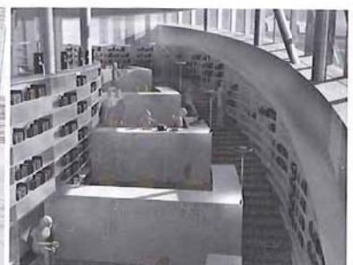
La nouvelle bibliothèque.