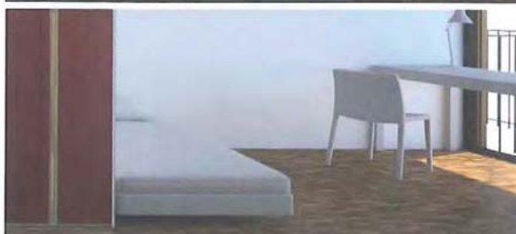
Haut, coin cuisine | Bas, coin chambre