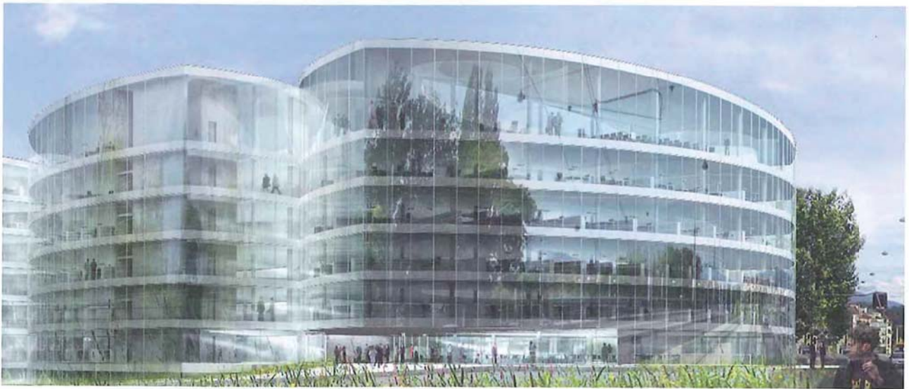
Vue générale du bâtiment depuis l'avenue de la Paix – Photos Eric Ott, IPAS Architectes SA.

L'autorisation de construire est attendue d'ici le printemps. Les travaux débuteront en été 2011 et s'achèveront en été 2013. Pour le financement, les dons très généreux de la fondation Wilsdorf pour le terrain et de Mme Kathryn W. Davis, ancienne de l'Institut, pour la bibliothèque seront complétés par un emprunt contracté par l'Institut.